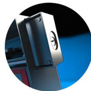
Innfelt hæverkssikret hengselås i klasse 3