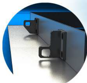
Doble låspunkter for økt sikkerhet