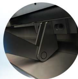
Innbruddssikre og skjulte detaljer